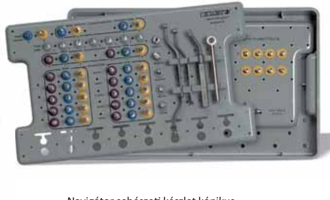
Navigator sebészeti készlet kónikus implantátumokhoz SGTIKIT

A Navigator System laboratóriumi készlet kompatibilis sebészeti sablon használatával lehetővé teszi a sebészeti beavatkozás előtt mesterminta készítését, amelyben az analógok helyzete pontosan tükrözi az implantátumok elhelyezkedését.