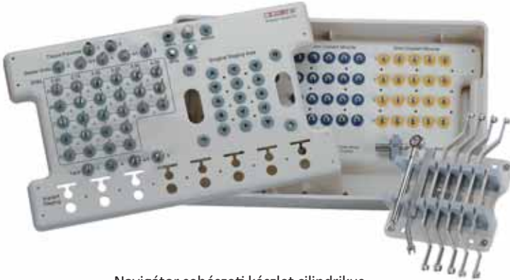
Navigator sebészeti készlet cilindrikus implantátumokhoz SGKIT

Egy tervezési rendszer akkor teljes és hatékony, ha a Navigator System technológiával párosul.